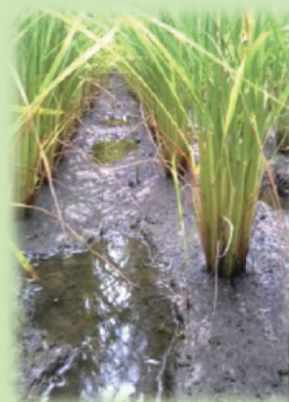
飽水管理 足跡に水が溜まっている状態