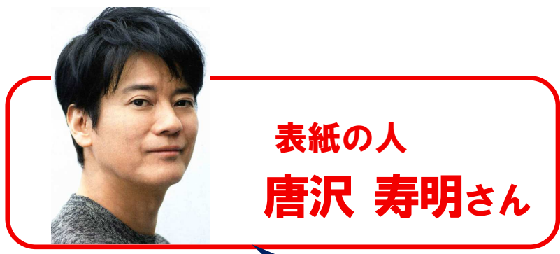
表紙の人 唐沢 寿明さん