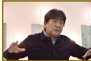
第1回 佐渡 裕さん (指揮者)

人と人との出会いやつながりによって、私たちの人生は大きく変わっていきます。毎回、各界の著名人にそんなエピソードを伺いながら、協同のたいせつさを改めて見直す連載企画です。