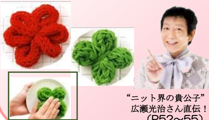
“ニット界の貴公子” 広瀬光治さん直伝！ (P52~55)