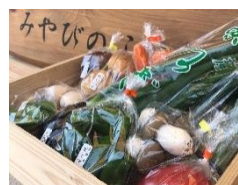
京旬菜 御室のよしむら