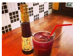
キネマ・キッチン