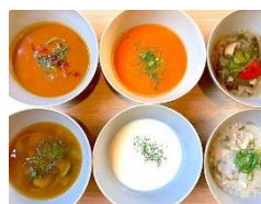
Soup Dining PanBoo