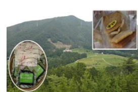
宕陰の野菜・特産品