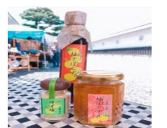
水尾特産品加工組合