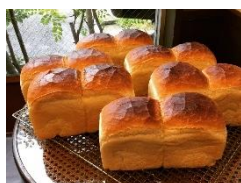
タローベーカリー